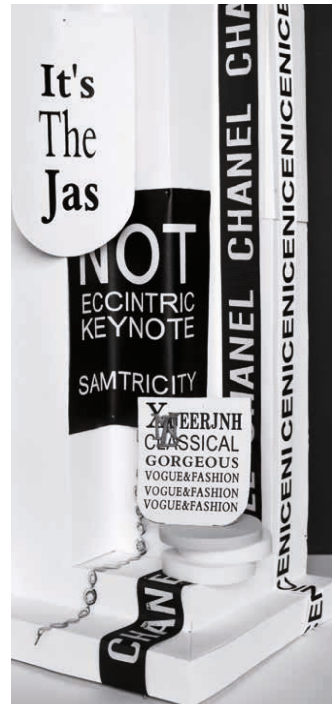
„We Don't Own Anything“