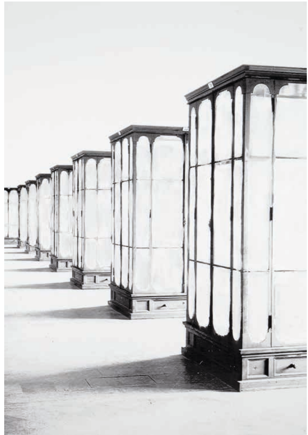
„Der Große Gewinn“